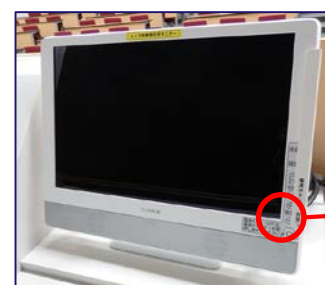
<カメラ確認用モニター>